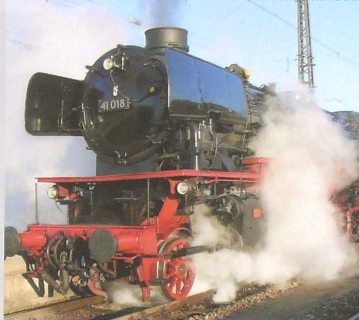
Sonderfahrten im „König-Ludwig-Dampf-Express“