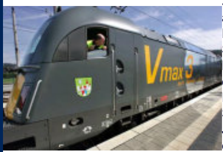
Weltrekord für die Lokomotive der Österreichischen Bundesbahn.

Die Rekordfahrten fanden auf der Neubaustrecke Nürnberg-Ingolstadt zwischen